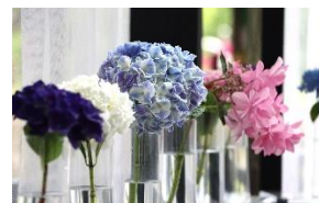
あじさいシェルフ