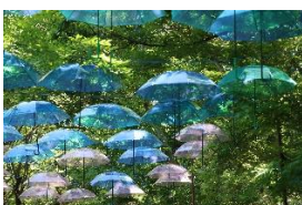
アンブレラスカイ

あじさいフェアならではの魅力を体感いただけるフォトスポットに、ぜひお立ち寄りください。