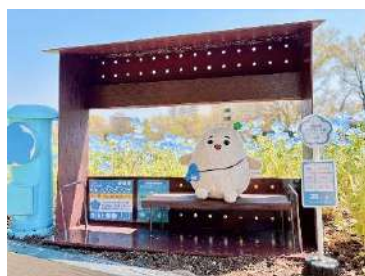
お気に入りのぬいぐるみを撮影する『ぬい撮りスポット』