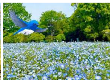
ARを活用して隠れた「しあわせの青い鳥」を探す特別企画