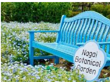
ネモフィラと同じブルーで統一された『青いベンチ』

ネモフィラの魅力を引き立てるフォトスポットをネモフィラ畑に設置しており、来園の記念として写真撮影をお楽しみいただけます。撮影した写真はフォトコンテストへの応募が可能で、春の思い出を形に残しながら気軽に参加いただけます。