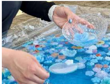
ネモフィラキャンドルすくい 1回 500円 （定員 1日200名）※土日祝限定 子どもから大人まで楽しめる体験企画として、キャンドルすくいを開催しています。 すくったキャンドルはお持ち帰りいただけます。 ※お持ち帰りいただけるキャンドルには、個数制限がございます。