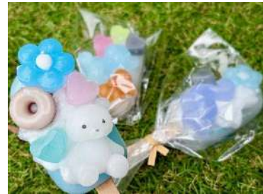
キャンドルワークショップ 1つ 500円 （定員 1日100名）※土日祝限定 キャンドルすくいできったキャンドルを、アイス型キャンドルにデコレーションして持ち帰ることができるワークショップもあわせて開催しています。 ※キャンドルすくいをされた方のみご参加いただけます。