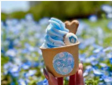
ネモフィラソフトクリーム 1つ 500円 （1日300個の数量限定販売）※土日祝限定 ネモフィラと同じ淡いブルーが印象的な、ラムネ味のソフトクリーム。 ネモフィラ畑の景観をイメージした爽やかな色合いと味わいで、花の観賞とあわせて楽しめる、フェア期間限定のメニューです。