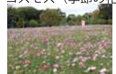
コスモス (季節の花畑)

休園日：月曜日 (祝日の場合はその翌平日) 年末年始 (12月28日～1月4日)