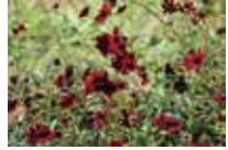
チョコレートコスモス (チョコモカ)