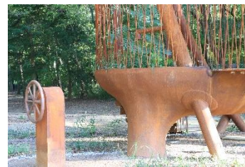
子ども用揚水体験装置