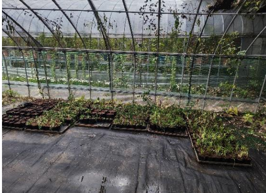
バックヤードで育苗中の植物

グラウンディングツリーは、長居植物園の二次林「長居の里山」の管理拠点としている「里山ひろば」に設置しています。グラウンディングツリーには自然と人がつながる共生のシンボルとして、床やスラブの植物は、里山を感じさせ、かつ大阪府南部・大和川流域の自然植生の要素を取り込んだ樹種を選定しています。それらの植物は、長居植物園里山ボランティアによる活動の一環で、長居植物園内で採取して育苗したものです。