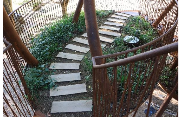
グラウンディングツリーへ植栽