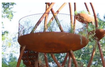
「葉」を模した、植物が育つ9つの床

自然エネルギーを活用する植物のメカニズムを知り、人が植物とどのように関わっていくべきかを学ぶ施設を目ざし、植物園の景観になじむように、1本の樹木が植樹されるようなイメージで計画されました。