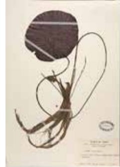
▲長居植物園の池のオニバス 1976年に採られたオニバスの標本 (自然史博物館所蔵)

長居公園や長居植物園の植物・昆虫などの標本や観察データから、50年前から現在までの長居公園周辺の自然を紹介します。