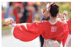
大阪泉州よさこい連 彩