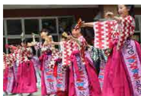
EXPOよさこい2025 公式ジュニアチーム