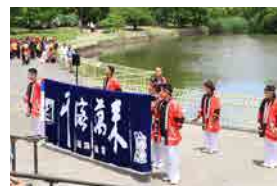
道具屋筋まいど連