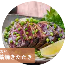
薫ざんまい 鯉の薫焼きたたき