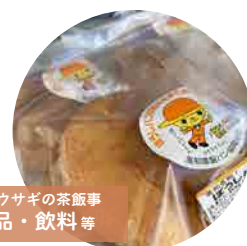
トラとウサギの茶飯事 特産品・飲料等

高知県商品を500円以上お買い求めいただいた方を対象にガラガラ抽選会(くじ引き)を開催! (ハズレなし、景品なくなり次第終了)