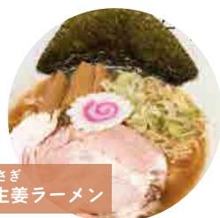
麵やうさぎ 高知生姜ラーメン