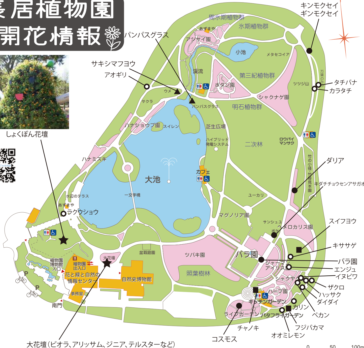
大花壇(ビオラ、アリッサム、ジニア、テルスターなど)